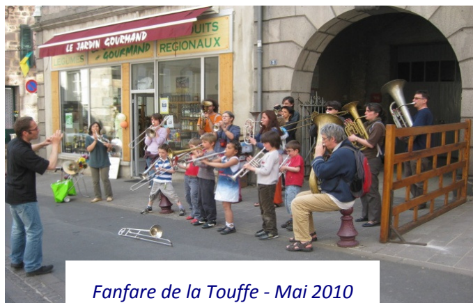
Fanfare de la Touffe - Mai 2010

- Organisation de la « Semaine du Bonheur » (première édition en mai 2010) : conteur itinérant, ateliers d'écriture, interview filmées d'habitants du territoire autour de la question : « C'est quoi pour vous le bonheur ? » et diffusion du film au cinéma municipal, intervention de la Fanfare de la Touffe : initiation avec un chef de fanfare à l'art de souffler dans des cuivres et déambulation dans les rues, dame tartine, art postal, fresque géante, etc.